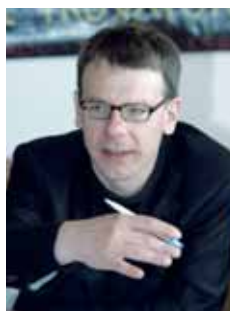
Vermisst Rechtstreue: Grünen-Politiker Markus Kurth

Im Bereich der beruflichen Rehabilitation sind noch eine Menge Aufräumarbeiten und Reparaturen zu leisten. Es gilt mehr zu tun, um eine Vernetzung der Landschaft zu erreichen. Denn die Zusammenarbeit der verschiedenen Rehabilitationsträger erweist sich als schwierig – z.B. im Arrangement BA, Kommune und Arbeitsgemeinschaften. Da will jeder nur das bezahlen, was er auch steuern kann. Aber in komplexen Prozessen der beruflichen Rehabilitation kommt es darauf an, Leistungen miteinander zu verzahnen – hier sind Budgets nicht so leicht auseinander zu halten. Und da beginnen die Schwierigkeiten. Kurz: Wir müssen stärker dahin kommen, dass Kostenträger miteinander reden. Das grundsätzliche Problem im ganzen Feld der Behinderung ist, dass es so zersplittert und nicht in einem