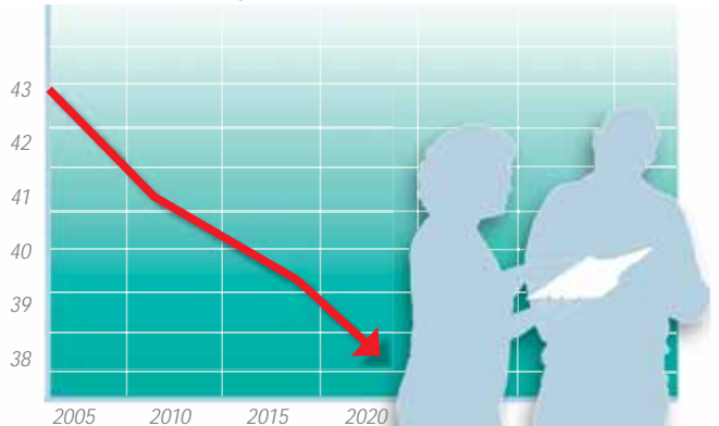
Zahl der Erwerbstätigen in Millionen

dass man damit sein täglich Brot verdienen kann und dennoch offen zu bleiben für alle anderen Bereiche und keine Entwicklungen links und rechts von dem was heute gemacht wird, zu verschlafen.