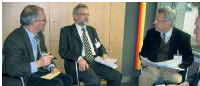
Im gemeinsamen Austausch weiter: In Heidelberg erarbeiteten die regionalen Arbeitsgruppen, Mitarbeiter der Berufsförderungswerke und Reha-Träger die nächsten Schritte zur Umsetzung des Neuen Reha-Modells.

Dass es angesichts der Vielfalt und Heterogenität der BFW bei aller Orientierung an den Vorga-