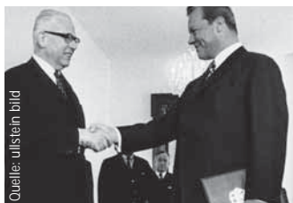
Bundespräsident Gustav Heinemann und Bundeskanzler Willy Brandt machten sich stark für Rehabilitation.

Bereits 1957 war durch die Gesetze über die „Neuregelung des Rechts der Rentenversicherung der Arbeiter und Angestellten“ berufliche Rehabilitation als Regelleistung der Rentenversicherung eingeführt worden. Die Rehabilitationsleistungen der Rentenversicherung sind seitdem unter dem Grundsatz „Rehabilitation vor Rente“ zu gewähren, um ein vorzeitiges Ausscheiden der Versicherten aus dem Erwerbsleben zu verhindern und eine möglichst dauerhafte Eingliederung in das Erwerbsleben zu sichern. Mehr und mehr wurde erkannt, dass Eingliederung in das Arbeitsleben gleichzeitig Teilhabe an der Gesellschaft bedeutet und dass Arbeit mehr ist als Broterwerb. Arbeit entscheidet über Zugehörigkeit oder Außenseitertum.