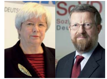
VdK-Präsidentin Ulrike Mascher SoVD-Präsident Adolf Bauer

Ulrike Mascher: Als bedeutenden Schritt für die gleichberechtigte Teilhabe am Arbeitsleben sieht der Sozialverband VdK die Beseitigung der Benachteiligung behinderter Kinder im Bildungsbereich vor. Da Förder- und Sonderschulen oft nicht die gleichen Startbedingungen bieten und damit der Weg zum allgemeinen Arbeitsmarkt er-