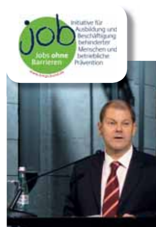
Bei der job-Veranstaltung „Unterstützte Beschäftigung“: Olaf Scholz.

Integrationsämtern, Rehaträgern -und Einrichtungen sowie dem Beirat für die Teilhabe behinderter Menschen durchgeführt. Im Rahmen der job-Initiative findet am 20. April 2009 in Zusammenarbeit mit der ARGE die Veranstaltung „Beschäftigung sichern durch Kooperationen“ statt.